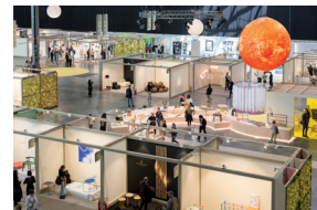
06 SaloneSatellite 2023