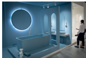
05 Salone Internazionale del Bagno 2022