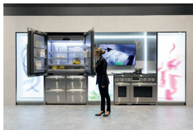
04 FTK – Technology For the Kitchen 2022