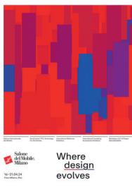
07 Campagna di comunicazione Salone del Mobile. Milano 2024