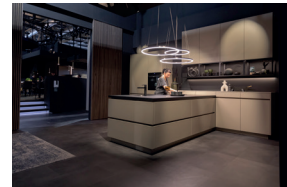
03 EuroCucina 2022